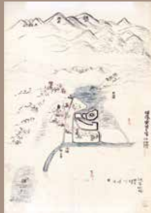
「安田古城址按図」 (['安田志料』の挿図)