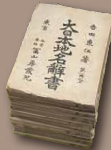
『大日本地名辞書』初版本の表紙