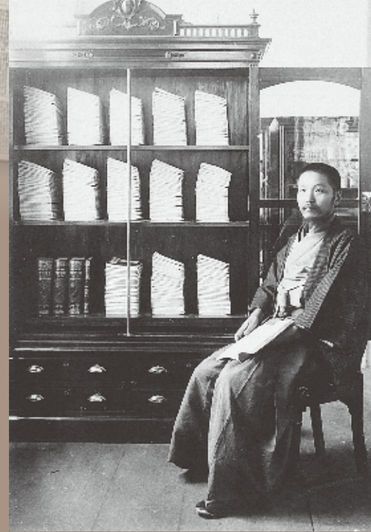
完成した『大日本地名辞書』原稿の前で(1907年頃)