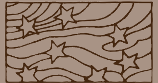
東伍デザインによる背表紙のマーク