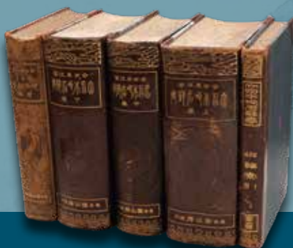
『大日本地名辞書』 第2版(富山房)